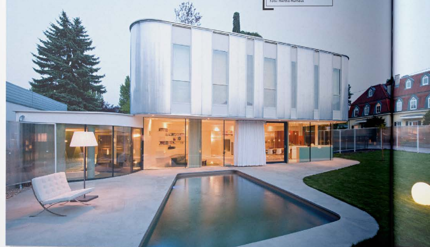
Haus 500m2, Wien

Everytime a new challenge Für jedes Projekt neu – das ist die Devise von Caramel architekten. Das Büro setzt auf die erfolgreiche Teilnahme an internationalen Wettbewerben – daraus resultieren auch die jüngsten Bauaufträge. Neben der Umsetzung der Großprojekte Science Park Linz, adidas World of Sports west Herzogenaurach, WIFI-Dornbirn, Betriebsgebäude Ansfelden und Schule Krems widmet sich das Trio Designstudien und innovativen Einfamilienhausprojekten. Idealismus und Erfindergeist stehen dabei ganz oben. Vortragsreihen, Lehrveranstaltungen und Kunstprojekte wie der Beitrag für den österreichischen Pavillon bei der Architekturbiennale 2016 in Venedig sind für Caramel das Salz in der Suppe des Architekturalltags.